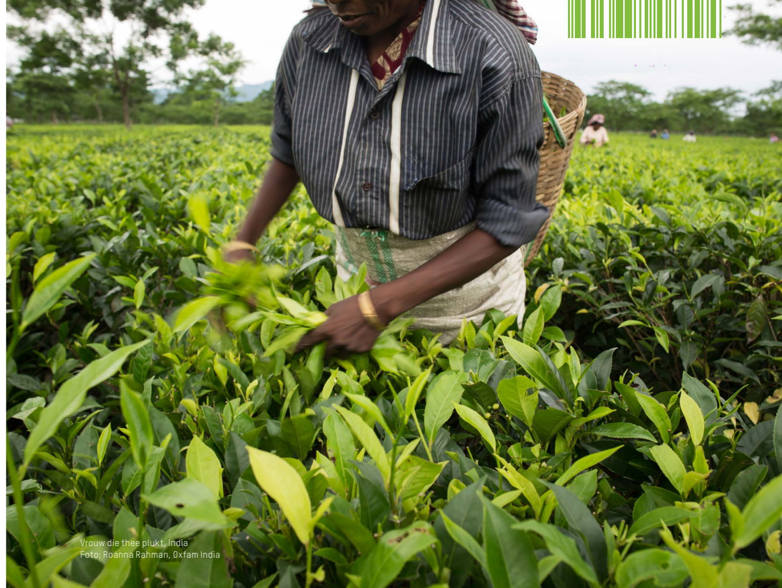
Vrouw die thee plukt, India

Oxfam Novib is een wereldwijde beweging van mensen die samen armoede en onrecht verslaan. Oxfam Novib is onderdeel van Oxfam International, een confederatie van 20 ontwikkelingsorganisaties. Samen zijn we de grootste internationale beweging tegen armoede en werken we in 93 landen. Voor meer informatie, zie: www.oxfamnovib.nl