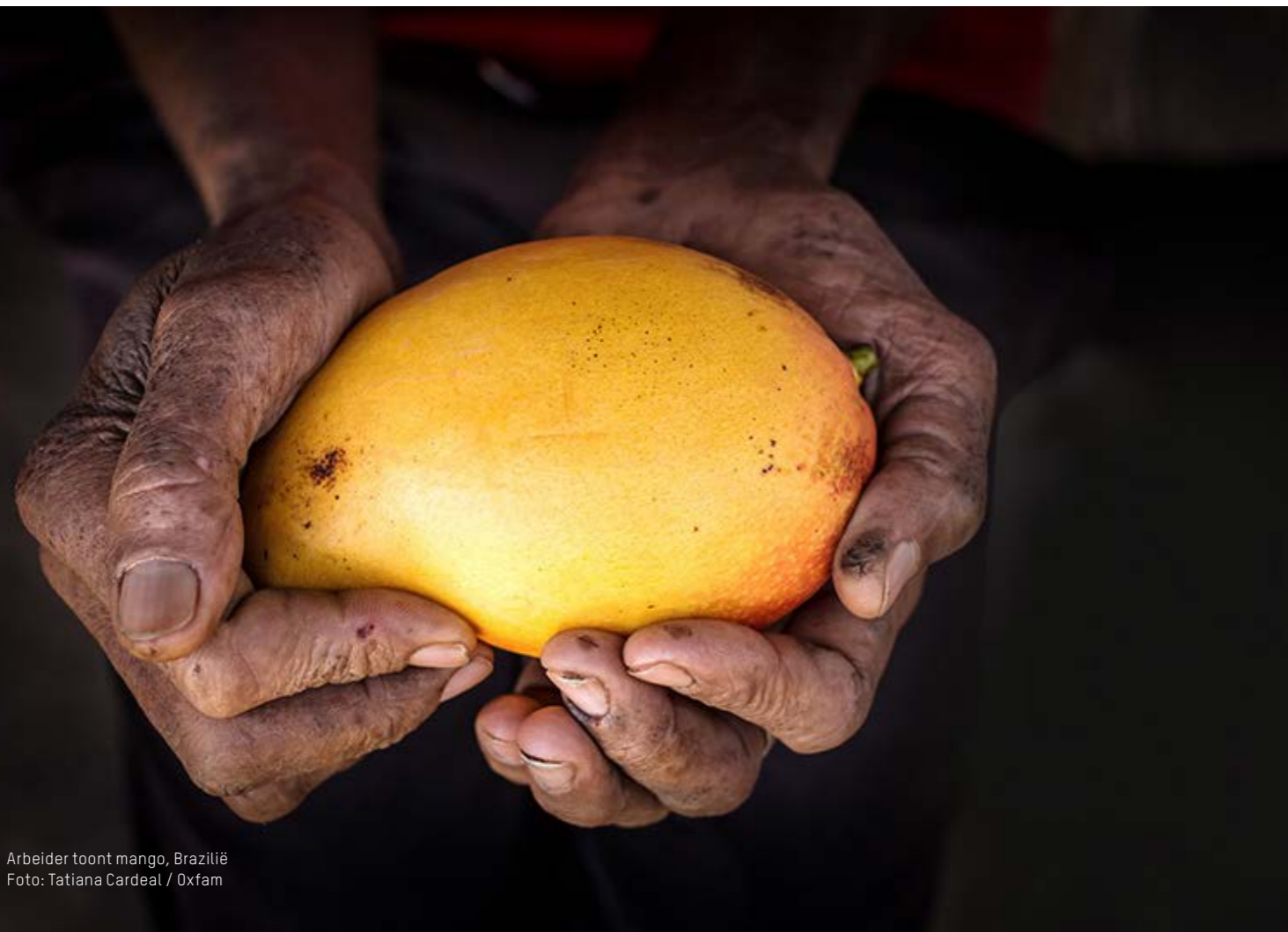
Arbeider toont mango, Brazilië